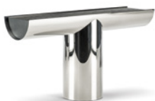
08 PILOTIS CONSOLLE CONSOLLE CM 140X36 H75