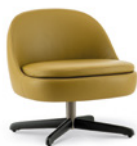
04 SENDAI POLTRONE LOUNGE GIREVOLI CM 65X67 H67